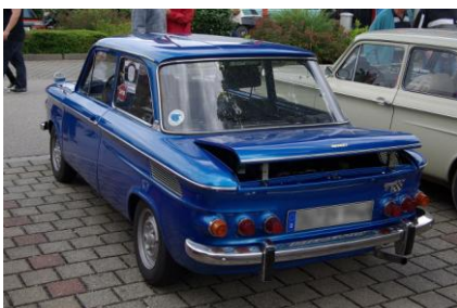
Prinz 1000 TT (Typ 67b)

Der NSU Prinz 1000 TT , der NSU TT und der NSU TTS waren sportliche PKW-Modelle der NSU Motorenwerke AG und wurden 1965 bis 1972 in verschiedenen Varianten gebaut. Sie basierten auf dem Massenmodell NSU Prinz 1000