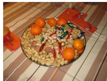
Ein dreifach Hoch auf drei Generationen Ochsenbein.

Unseren Gastgebern sei herzlich gedankt für die viele Arbeit und Gastfreundschaft.